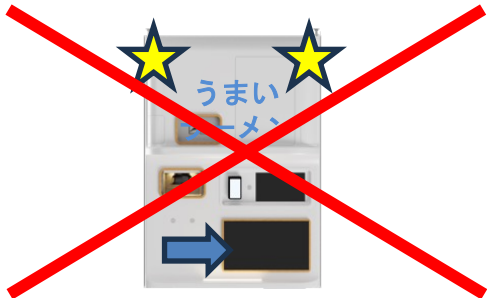
画像への装飾等の追加