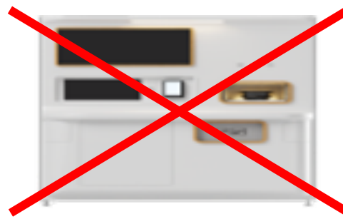
縦横比/縮尺比率の変更